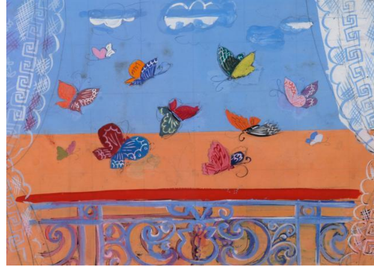
Raoul Dufy: «Δωμάτιο με ανοιχτά παράθυρα» 1928 και «Μπαλκόνι με πεταλούδες» 1930.

Το ΝΠΔΔ ΠΑΚΠΠΑ και συγκεκριμένα το Τμήμα Ζωγραφικής, καλεί όλους τους μαθητές του Δήμου Ελευσίνας – Μαγούλας, που είναι εγγεγραμμένοι ή μη σε οποιοδήποτε τμήμα ανηλίκων να συμμετέχουν στην ακόλουθη δράση για παιδιά, με θέμα: